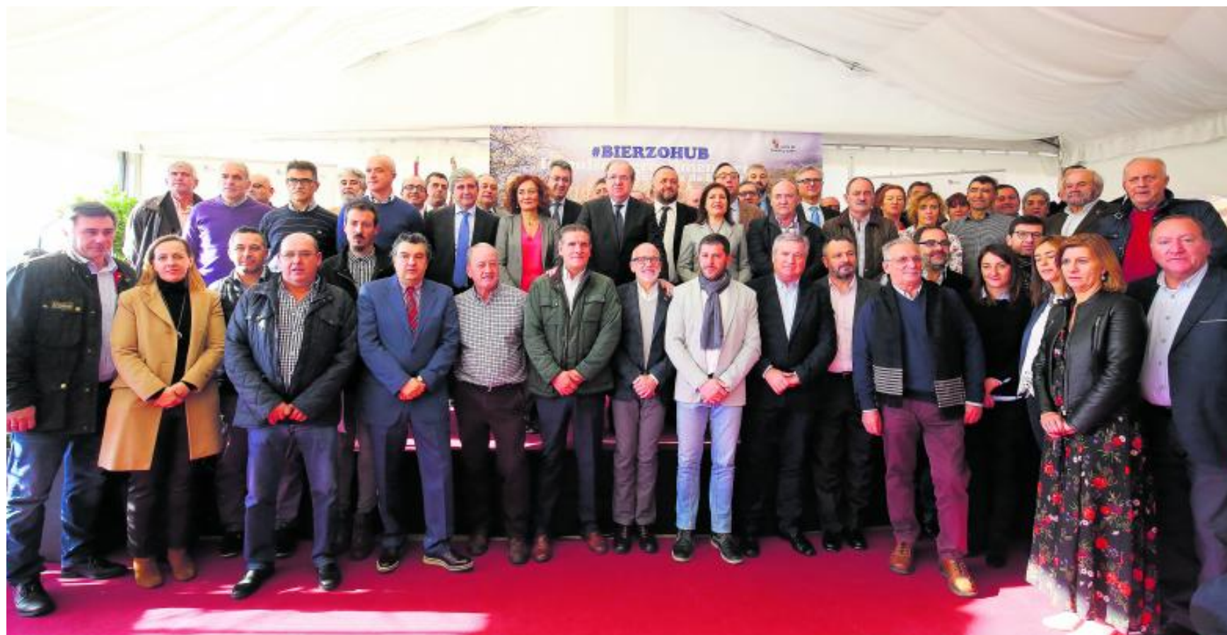
Unión del sector. Fotografía de familia de todos los representantes institucionales y empresariales que ayer por la mañana se reunieron en Cacabelos.