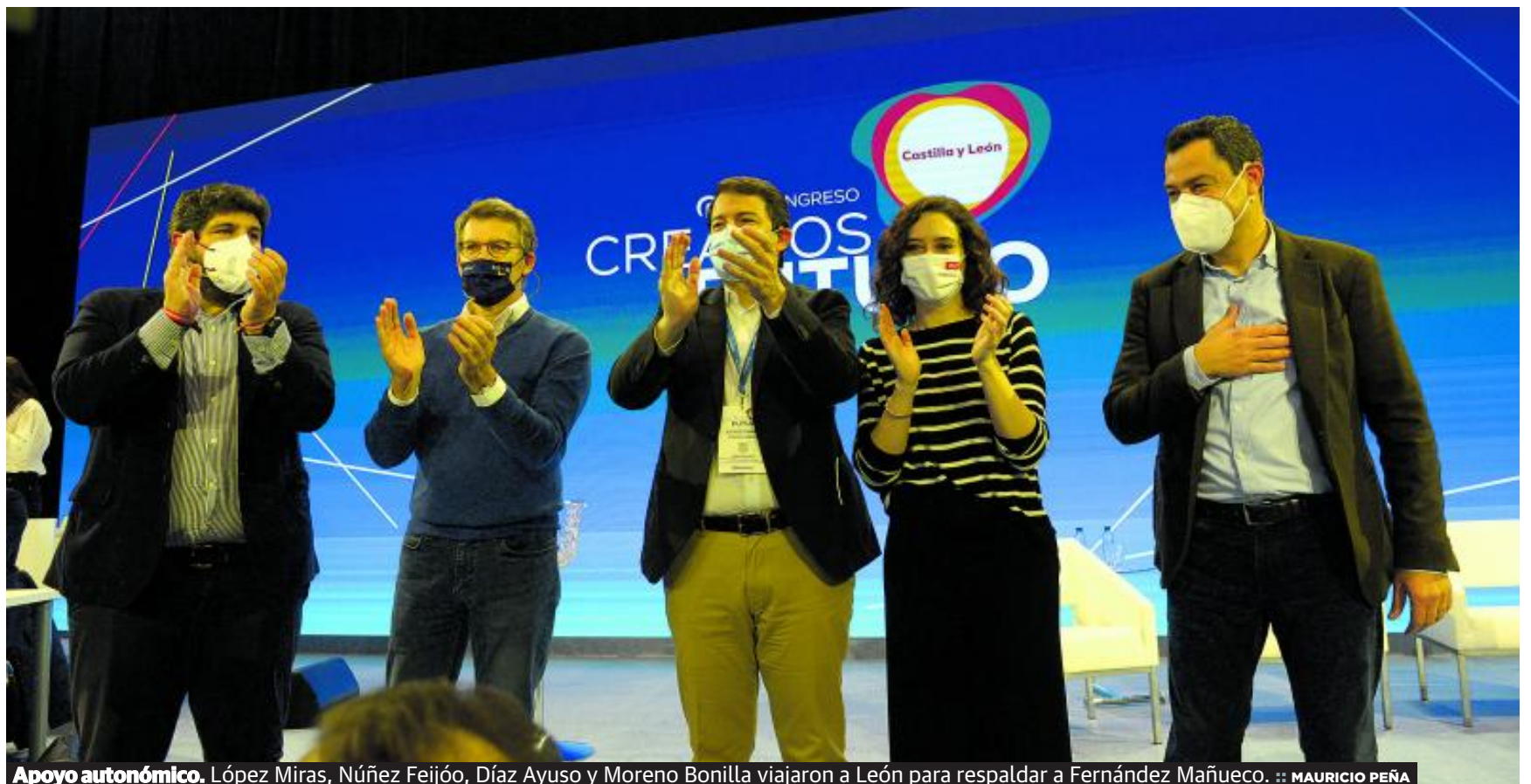
Apoyo autonómico. López Miras, Núñez Feijóo, Díaz Ayuso y Moreno Bonilla viajaron a León para respaldar a Fernández Mañueco.

para el próximo 13 de febrero, por lo que el cónclave se convirtió en realidad en un gran acto de precampaña. P2 Y 3